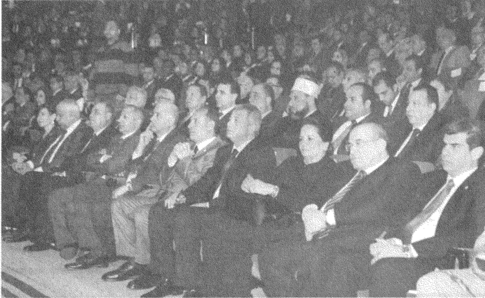
جانب من حضور المؤتمر