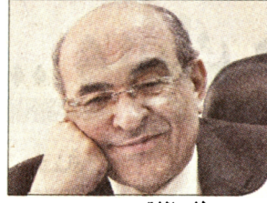
د. مصطفى الفقى

تنطلق فعاليات معرض الإسكندرية الدولي للكتاب في دورته السادسة عشرة، تحت شعار «فكر .. أدب.. فن .. إبداع» في حضور المملكة العربية السعودية كضيف شرف، ومشاركة دور نشر مصرية وعربية ودولية في الفترة ما بين ٣١ مارس الجاري حتى ٩ أبريل المقبل في ساحة المكتبة.