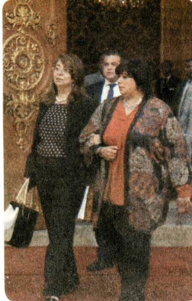
Les ministres Ghada Wali et Inès Abdel-Dayem.