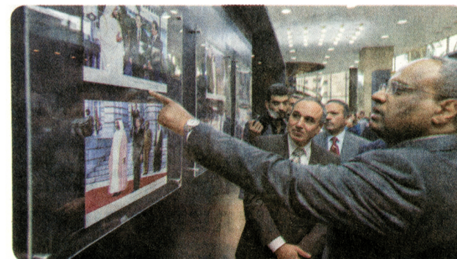
L'ambassadeur explique l'histoire d'une photo.