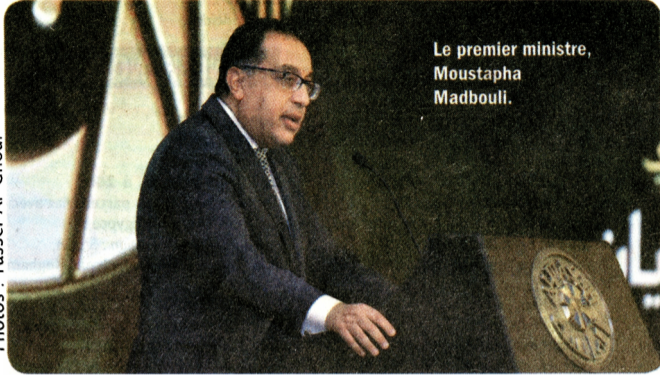
Le premier ministre, Moustapha Madbouli.