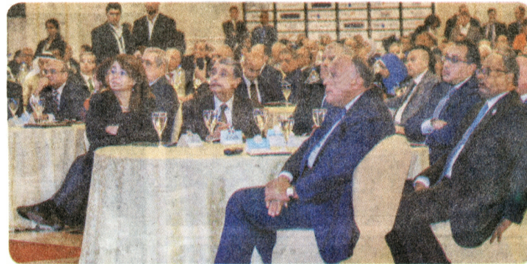
Le ministre des Affaires étrangères, Sameh Choukri, entouré des ministres.