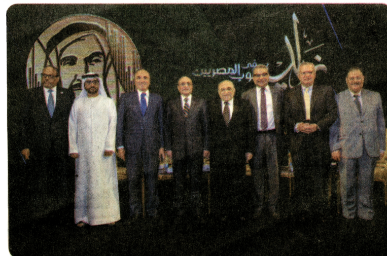
Les intervenants du colloque.