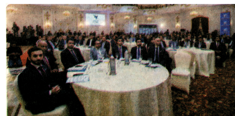
Le corps diplomatique de l'ambassade des Emirats au Caire.