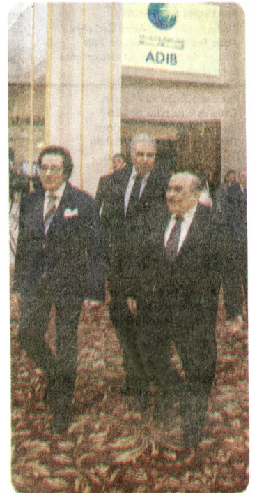
L'ancien ministre de la Culture, Farouk Hosni, avec Moustapha Al-Fiqi.