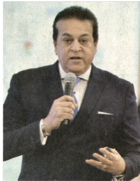
د. خالد عبدالغفار

أكد د. مصطفى مديبولي رئيس الوزراء، أن الحكومة تهدف إلى تحقيق تطوير شامل في التعليم في ضوء رؤيتها التي تتضمن إتاحة التعليم والتدريب للجميع دون تمييز في إطار مؤسسي كفه وعادل للجميع وأن يساهم أيضا في بناء الشخصية المتكاملة وإطلاق إمكانياتها لأقصى مدى لمواطن معتز بذاته يحترم قواعد الاختلاف وفخور بتاريخ بلاده وقادر على التعامل التفاضلي مع كل الكيانات الدولية والإقليمية. جاء ذلك خلال الكلمة التي ألقاها د. طارق شوقي وزير التربية والتعليم والتعليم الفني نيابة عن رئيس الوزراء. وأضاف شوقي، أن تحقيق هذه الرؤية يتطلب تطوير كافة جوانب العملية التعليمية «المعلم والمبنى المدرسي وطرق التدريس والتقويم وإدارة المؤسسات التعليمية»، وقال: لكي تتمكن مصر من ذلك بدأنا التفكير في حلول غير تقليدية لمشكلات متوالية لمراحل التعليم المختلفة وخاصة التعليم ما قبل الجامعي فجاه نظام التعليم الجديد والذي يهدف لتغيير المبادئ الفكرية والثقافة المجتمعية وخاصة ثقافة البيت المصري تجاه أهداف تطوير التعليم بدلا من اعتباره وسيلة للالتحاق بكلية ما تضمن وظيفة.