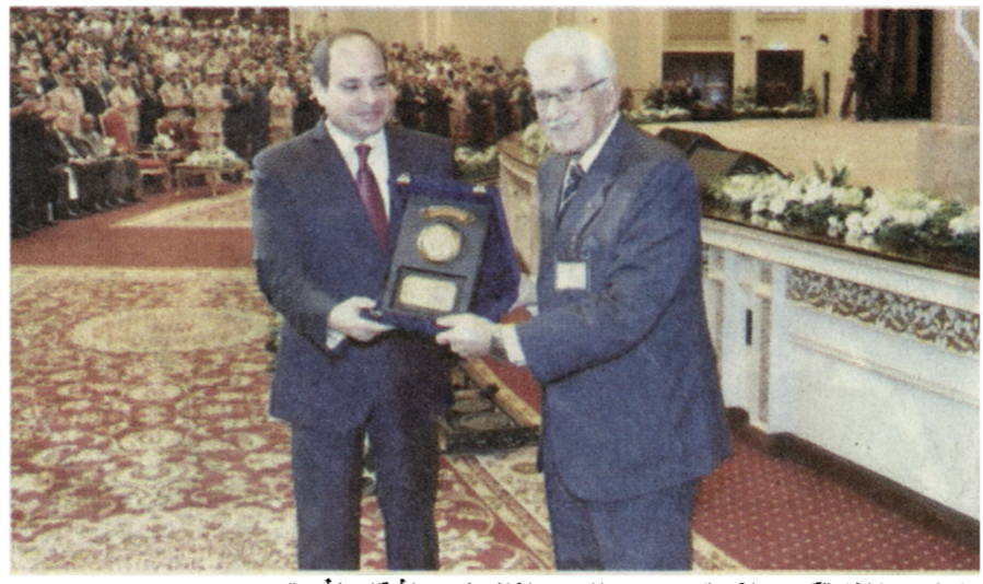
الرئيس خلال تكريم الفريق عبدرب التبي حافظ رئيس الأركان الأسبق