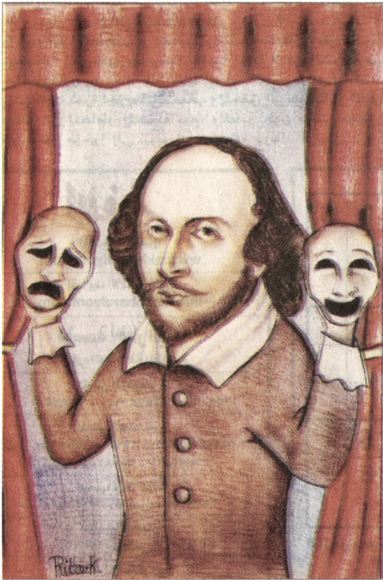
وليام شكسبير - بريشة : ريتا كيفوركيان