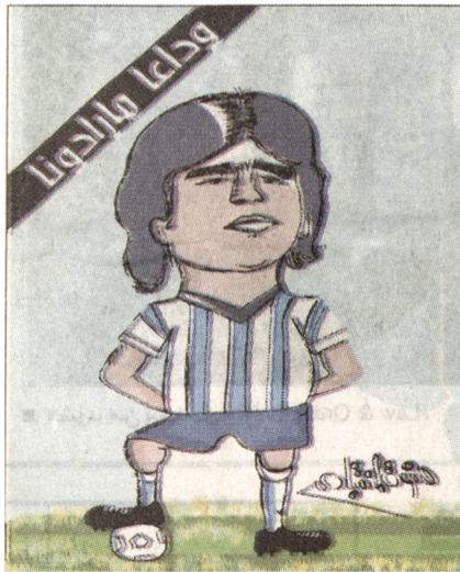
بريشة : صفوت المنقبادى