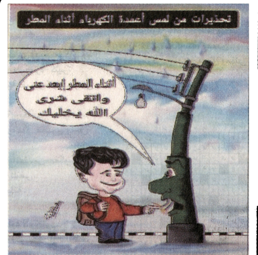
بريشة : علاء عبدالعزيز